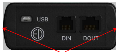
Рисунок 8 – нижняя торцевая панель места пломбирования (стикеры)