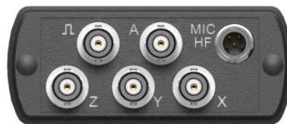
Рисунок 6 – верхняя торцевая панель модели ЭКОФИЗИКА-110А в исполнении «HF»