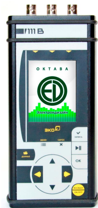
Рисунок 3 – лицевая панель модели ЭКОФИЗИКА-111В