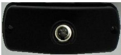
Рисунок 5 – верхняя торцевая панель модели ЭКОФИЗИКА-110А в базовом исполнении