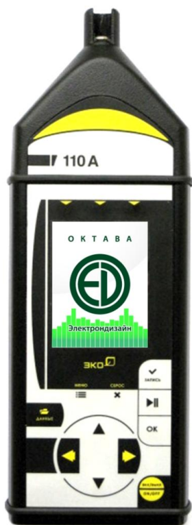
Рисунок 1 – лицевая панель модели ЭКОФИЗИКА-110А в базовом исполнении