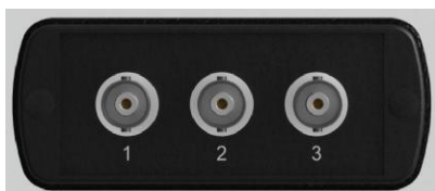
Рисунок 7 – верхняя торцевая панель модели ЭКОФИЗИКА-111В